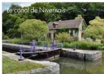
Le canal de Nivernais