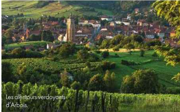
Les alentours verdoyants d'Arbois.