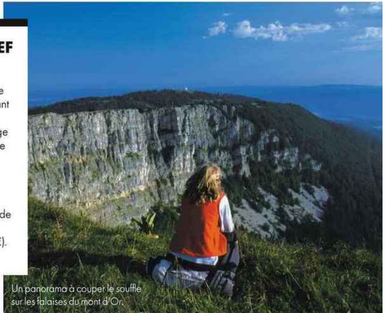
Un panorama à couper le souffle sur les falaises du mont d'Or.

2, place de l'Eglise, Milly-Lamartine. Tél. : 03 85 36 63 72. Ouvert du mercredi au dimanche, midi et soir.