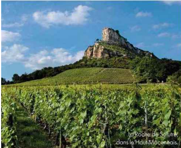
La Roche de Solutré, dans le Haut-Mâconnais.