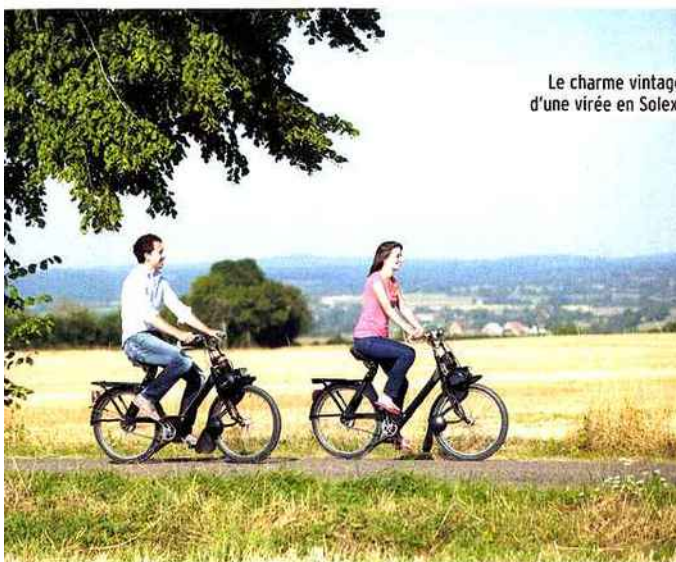
Le charme vintage d'une virée en Solex.